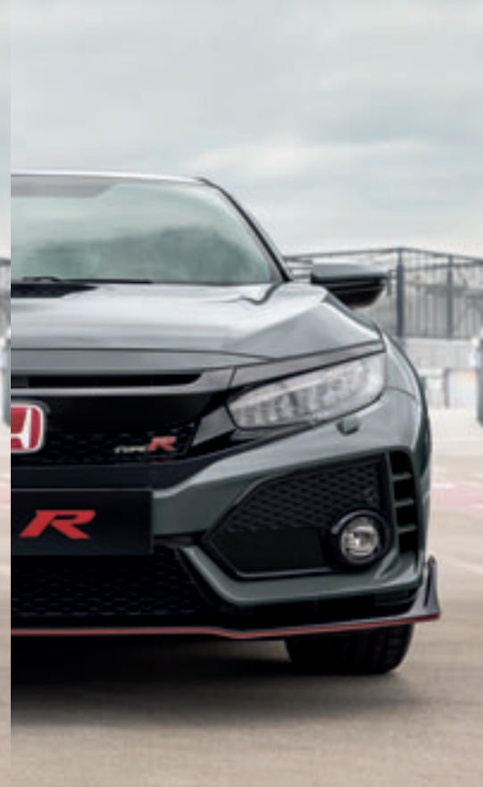
POLISHED METAL METALLIC