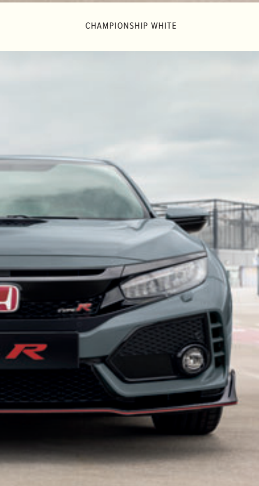
SONIC GREY PEARL